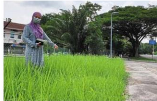
Selangor Klang's Bandar Botanic residents upset over uncut grass and clogged drains in township >2